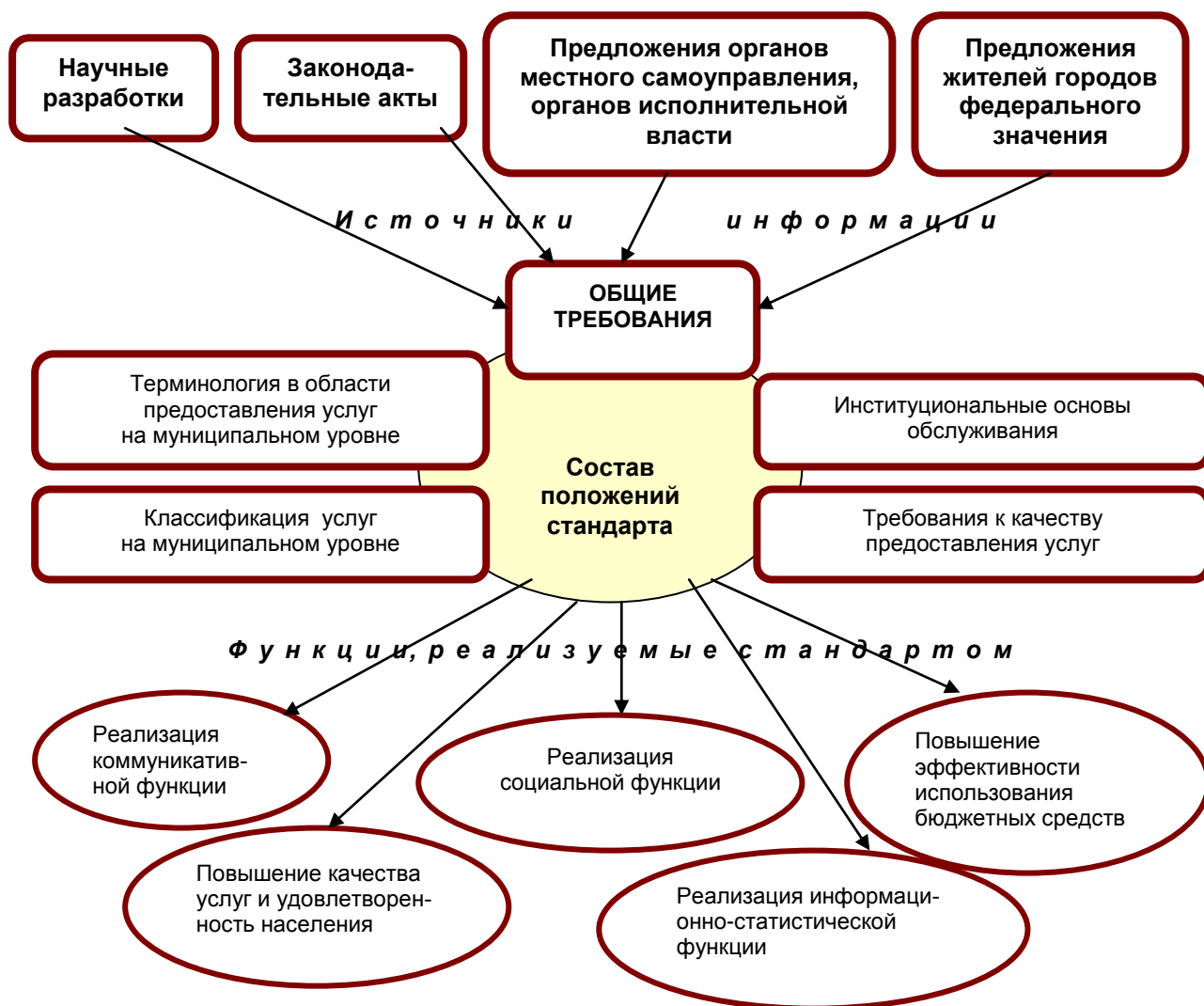
Рис. 3. Концептуальная модель национального стандарта «Услуги населению. Услуги, предоставляемые на муниципальном уровне. Основные требования»