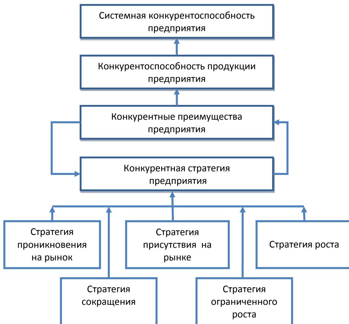
Рис. 1. Формирование системной конкурентоспособности предприятия

Системная конкурентоспособность предприятия – это комплексная характеристика, отражающая способность основных подсистем предприятия, взаимодействуя между собой, исчерпывающе адекватно реагировать на изменения параметров внешней и внутренней среды, на все факторы, воздействующие на предприятие, и за счет формирования и реализации конкурентных преимуществ, достигать комплекса целей развития предприятия и желаемого положения на рынке.