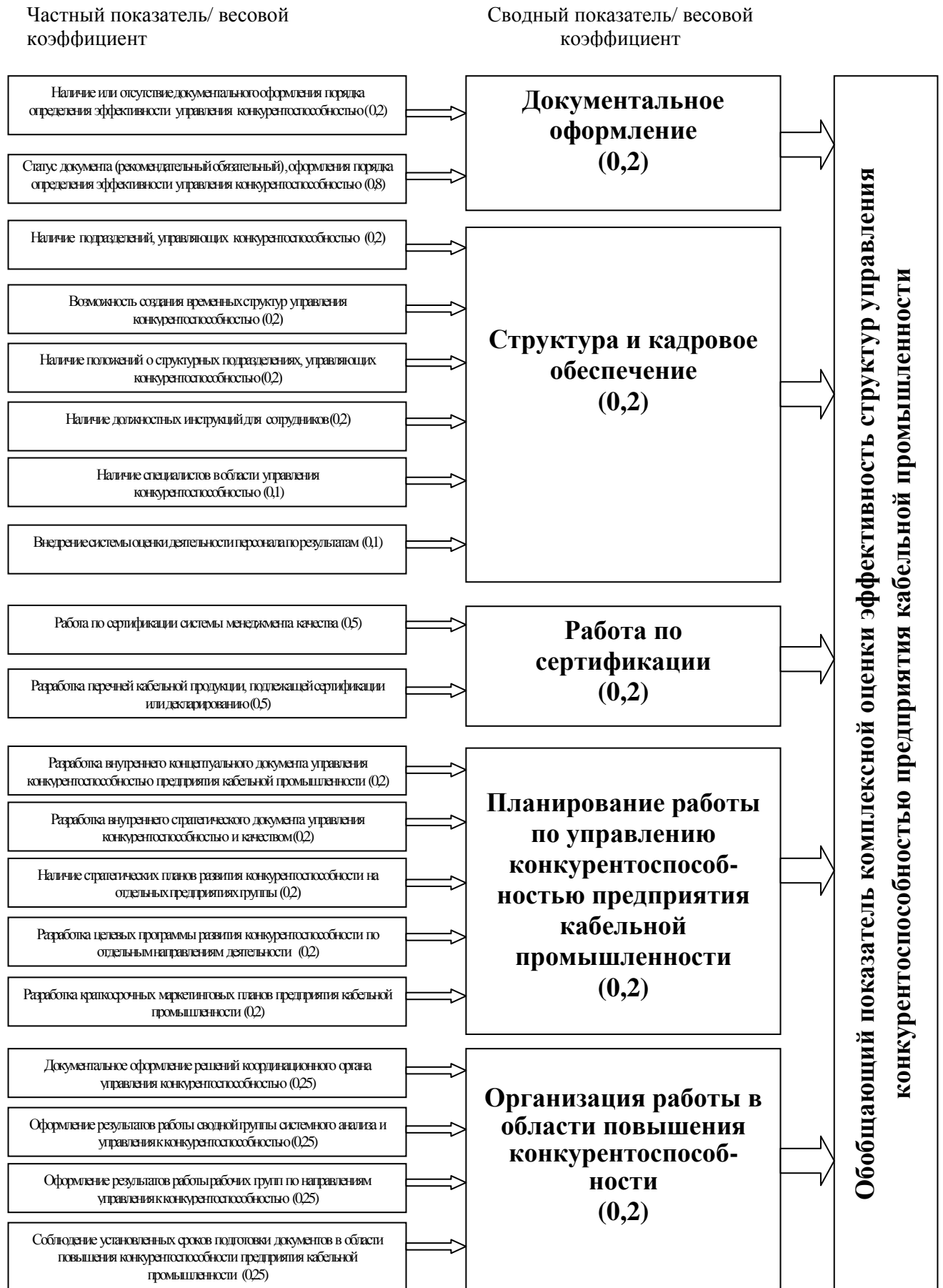
Рис. 4. Система показателей для оценки качества работы структур управления конкурентоспособностью предприятия кабельной промышленности